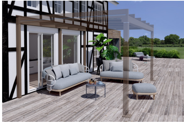
Beispiel Fachwerkfassade, Tragender Wandanschluss und Terrazza Pure