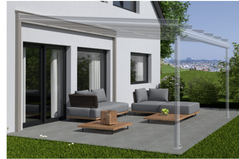
Beispiel stark gedämmte Hausfassade, Tragender Wandanschluss und Terrazza Originale