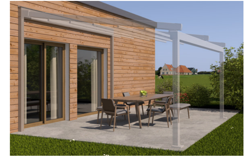
Beispiel Fertighaus an Holzständerwerk, Tragender Wandanschluss und weinor PergoTex II