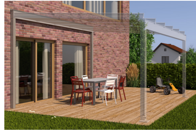
Beispiel Klinkerfassade, Tragender Wandanschluss und Terrazza Sempra